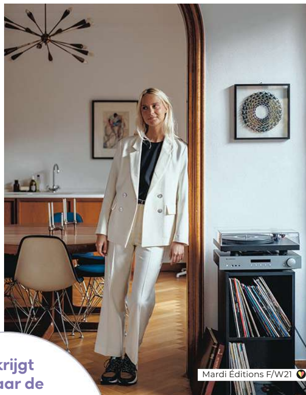
Mardi Éditions F/W21

Je krijgt dit jaar de kans je leven in te richten zoals jij dat wil, maar dan is het belangrijk dat je jezelf op de voorgrond plaatst en weet wat je wil.