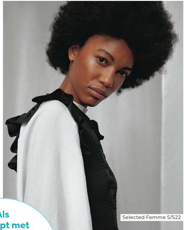
Selected Femme S/S22

Als je stopt met twijfelen, piekeren en uitstellen, kan dit een fantastisch jaar voor je worden.