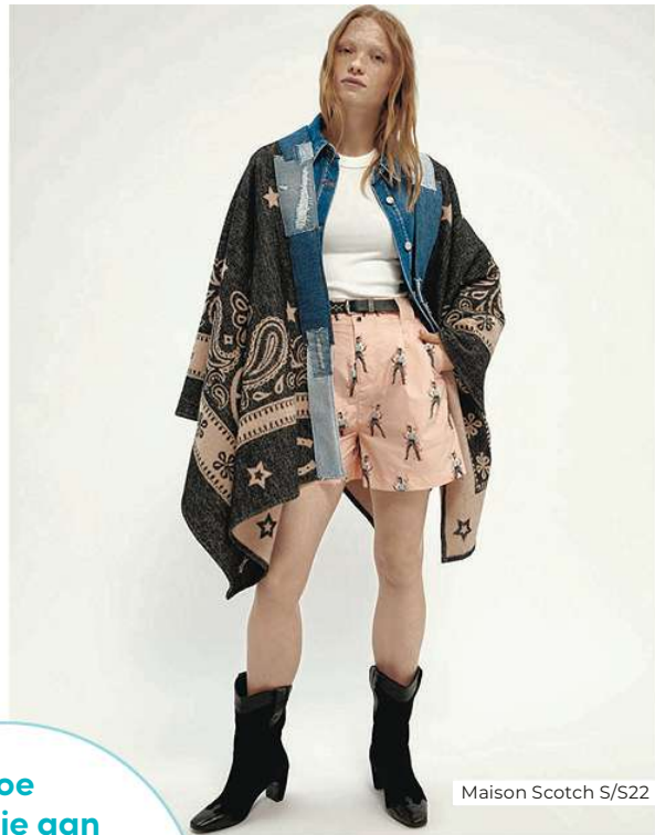
Maison Scotch S/S22