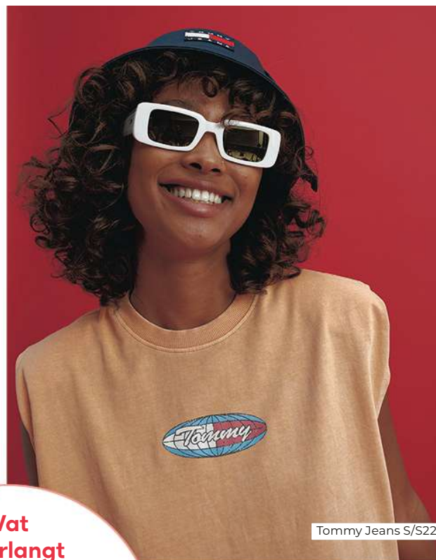
Tommy Jeans S/S22

De vurige Ram houdt van felle kleuren als rood en oranje. Als eerste teken van de dierenriem onderscheid jij je graag door middel van een opvallende outfit. Die mag gerust sportief en edgy zijn. Tip: til je streetwear naar een hoger niveau door binnen één kleurenpalet te blijven en een opvallend juweel in de mix te gooien.