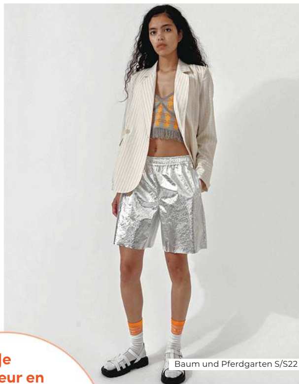
Baum und Pferdgarten S/S22