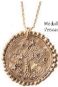
Médaille Constellation Verseau, MAJE, 65 €.