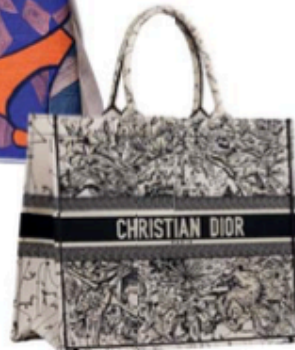
Cabas en toile Dior motifs zodiac Dior, 2 700 € sur dior.com