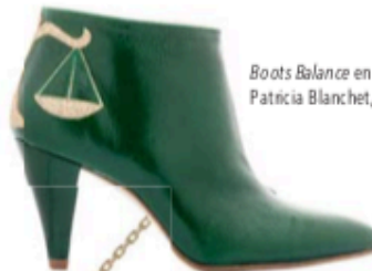
Boots Balance en cuir vert, Patricia Blanchet, 195 €