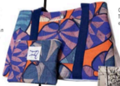
Cabas Zodiacue Ammoun- Trappeniers, 350 € sur esmeralda-ammoun.com