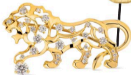
Broche en or et brillants Chanel Joaillerie, prix sur demande.