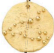
Pendentif constellation en argent plaqué or Poissons Sara Esther, 290 € sur saraesther.be