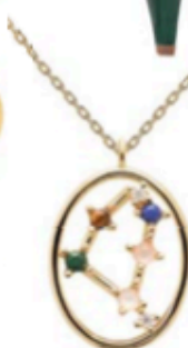
Collier Zodiac Constellation en plaqué or et pierres semi- précieuses, PDPAOLA, 65 €.