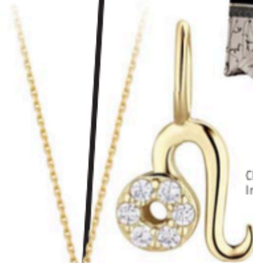
Charm Leo en plaqué or, Imagin, 25 €.