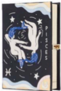
Pochette en toile brodée Zodiac Olympia Le-Tan, 1 100 € en exclu sur net-a-porter.com